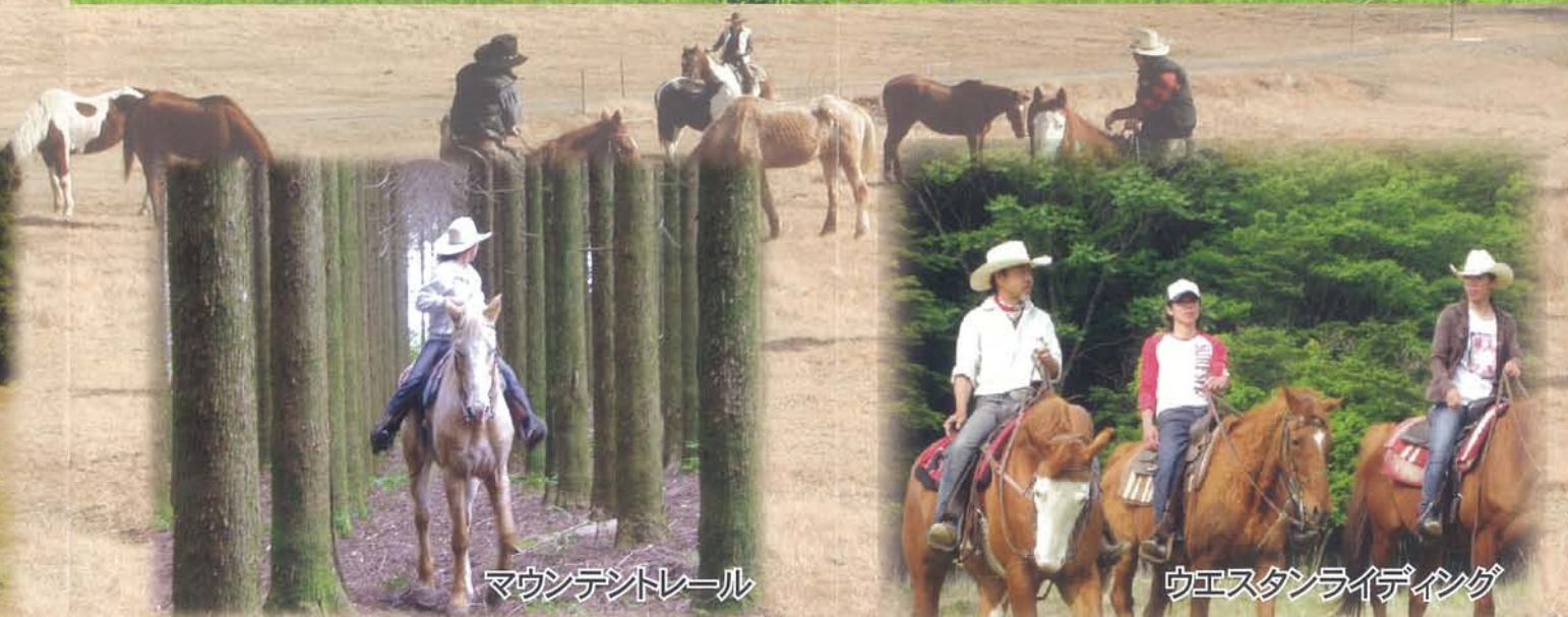
マウンデントレール