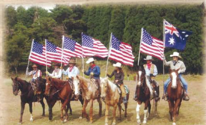
ウエスタンガドレール

Discover Japan's natural beauty while horseback riding through scenic Kirishima Mountains and Forests. In Kirishima, you can also enjoy natural hot springs and explore impressive mountain trails.