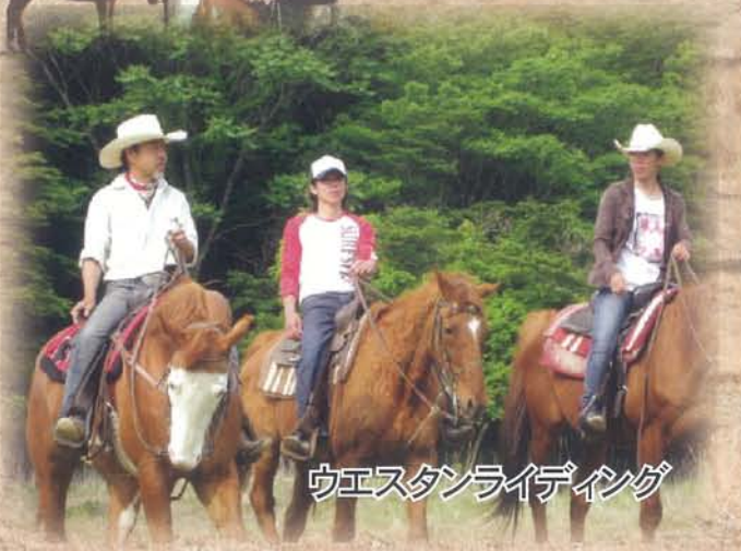
ウエスタンライディング